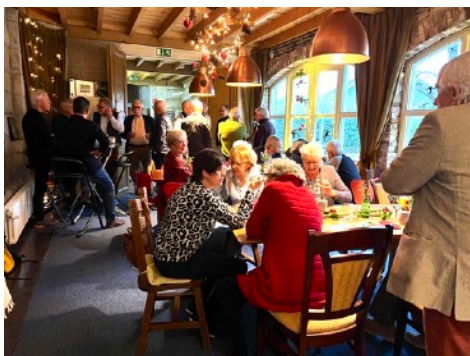
De vrijwilligers vieren samen Kerst in het koetshuis